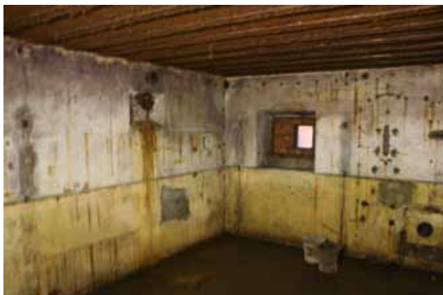
Het museum in juli 2009

Met die donatie hebben we dat museum een dienst bewezen. Allemaal blije gezichten. Misschien bent u er wel eens geweest. Zoniet dan volgen hier een paar aanwijzingen; je gaat de Boulevard op en volgt die tot je bijna bij de