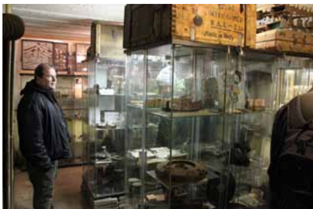
Het museum nu

haveningang bent. Daar staat het Patatpaleis en daarachter is de ingang tot de bunker. Tot vorig jaar was daar het GO FAST surfdorp. De bunker was daar ook, maar viel niet op in het Go Fast geweld.