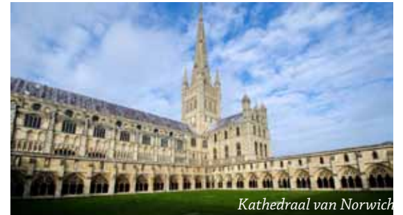
Kathedraal van Norwich

Norfolk behoorde in de middeleeuwen tot het dichtstbevolkte en rijkste graafschap van Engeland, dankzij de wolhandel en wolverwerking. Hier zijn imposante 'wool churches' gebouwd en Bury St. Edmunds en Little Walsingham waren naast Canterbury de belangrijkste bedevaartsplaatsen van Engeland. De hoofdstad van Norfolk, Norwich toont ook haar machtige middeleeuwse wortels; naast 30 middeleeuwse kerkjes is er ook een prachtige kathedraal en een fascinerend kasteel. De adel bouwde vanaf de 16de eeuw fraaie landhuizen; Oxburgh Hall, Blickling Hall, Felbrigg Hall, Ickworth, Holkham Hall, Sandringham (eigendom van Elizabeth II) zijn stuk voor stuk machtige en prachtige adellijke behuizingen.