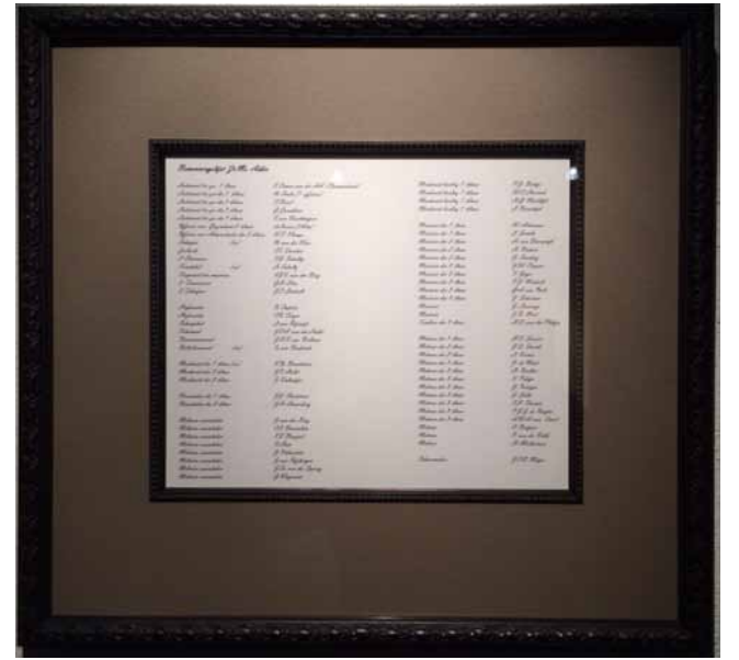
bemanningslijst in lijst

Van de Stichting Gedenkteken Zr. Ms. Adder kregen wij een ingelijste overdruk van de bemanningslijst van de rammonitor Zr.Ms. Adder, die in de nog klaarlichte avond van 5 juli 1882 op slechts 4,5 mijl WNW van Scheveningen op nooit opgehelderde wijze met man en muis verging. De originele lijst met 65 namen werd in een koperen koker ingemetseld in het gedenkteken dat op 10 april 2015 werd onthuld. Het staat op de boulevard naast de loopbrug voor de vuurtoren, recht tegenover de plek des onheils.