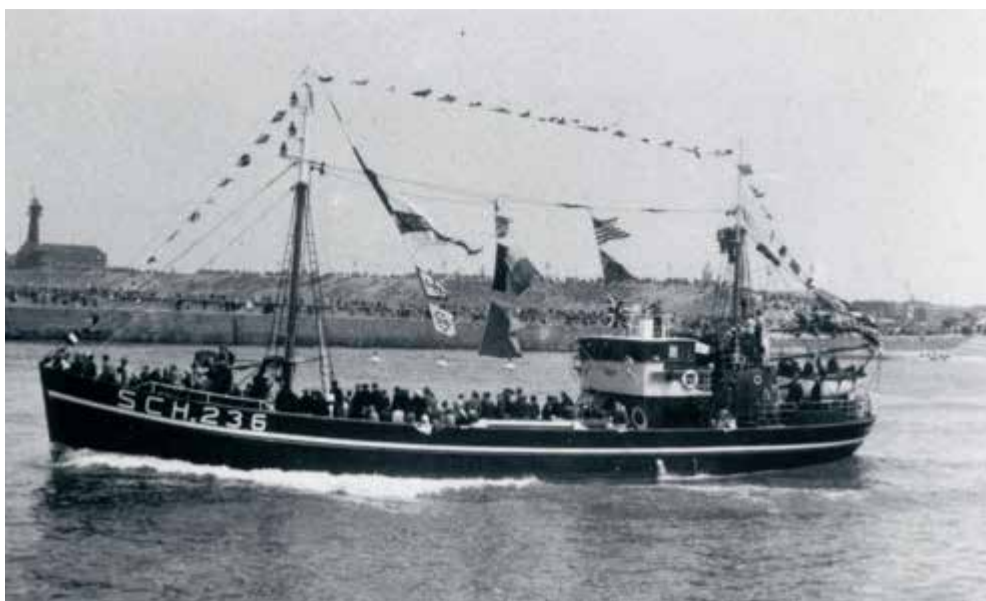
SCH236 op Vlaggetjes omstreeks 1950

In de publieksruimte werd de laatste hand gelegd aan het plafond of beter het 'dek', zoals deze on-