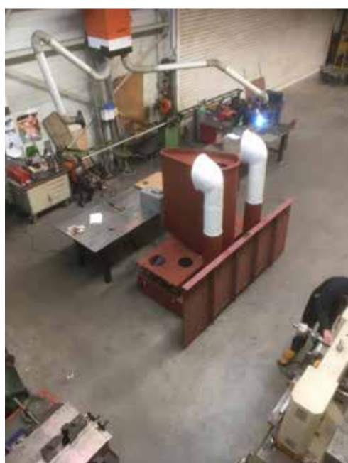
Schoorsteen met onderbouw in werkplaats van Boeg

Toen de logger begin jaren zeventig van eigenaar wisselde en werd verbouwd om als SCH 72 'Ali' de zgn. boomkorvisserij uit te oefenen, kwam er een sterkere motor van 960 pk in en werd het oorspronkelijke stuurhuis uit 1950 vervangen met inbegrip van de pijp. Er kwam een grotere en modern gestroomlijnde schoorsteen voor terug. Doordat de Noordster nu naar de oorspronkelijke staat van 1950 wordt teruggerestaureerd moest vanzelfsprekend ook de oorspronkelijke pijp weer terugkomen. De firma Boeg heeft daartoe vorig jaar de schoorsteen met onderbouw en windhappers in de werkplaats helemaal precies nabgebouwd overeenkomstig de bouwtekening uit 1949.