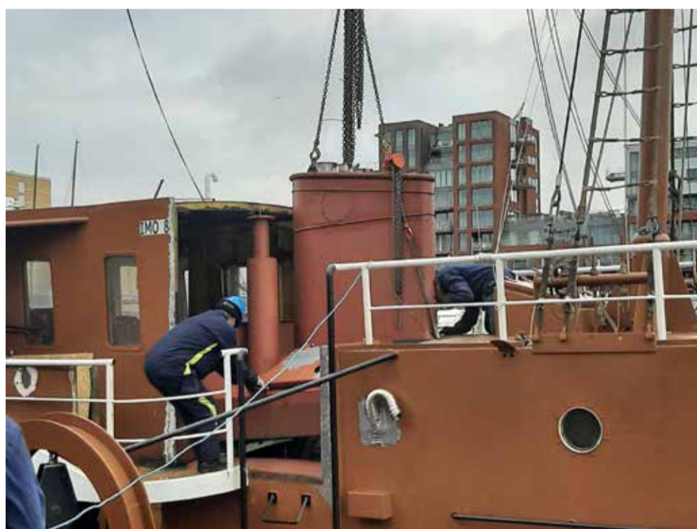
Nieuwe pijp bijna op z'n plek