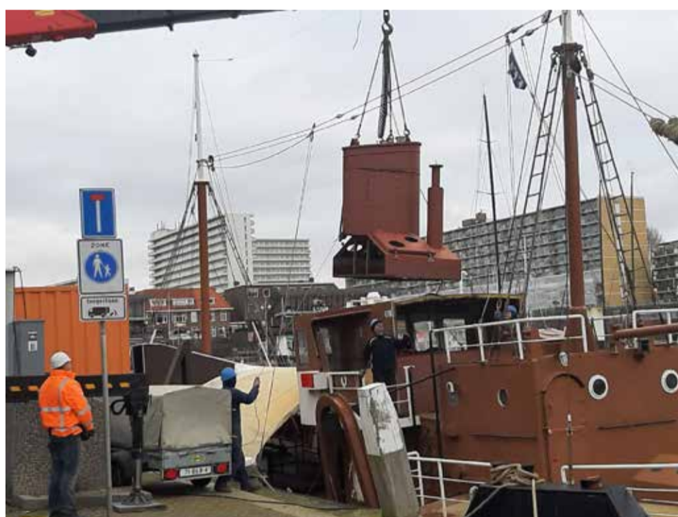
Nieuwe pijp wordt aan boord gezet