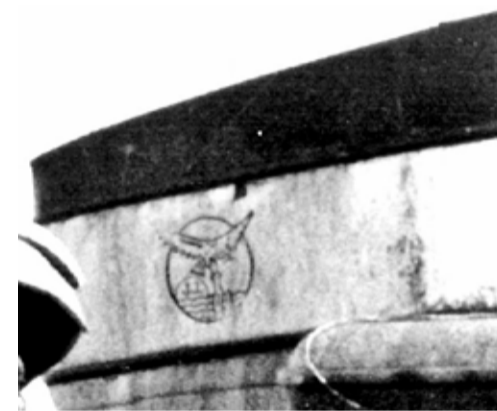
Pijp met logo begin jaren vijftig

De pijp zal binnenkort geschilderd worden in de kleuren van de rederij J.J. van der Toorn: zwart met witte band. Met daarop aan beide zijden het fraaie logo van de rederij anno 1950: een cirkel met daarin vier golflijnen, een dukdalf met daarop een meeuw met een haring in de bek en een halve zon aan de horizon met daarin de letters J.J. van J(oannes)J(acobus) van der Toorn Az.