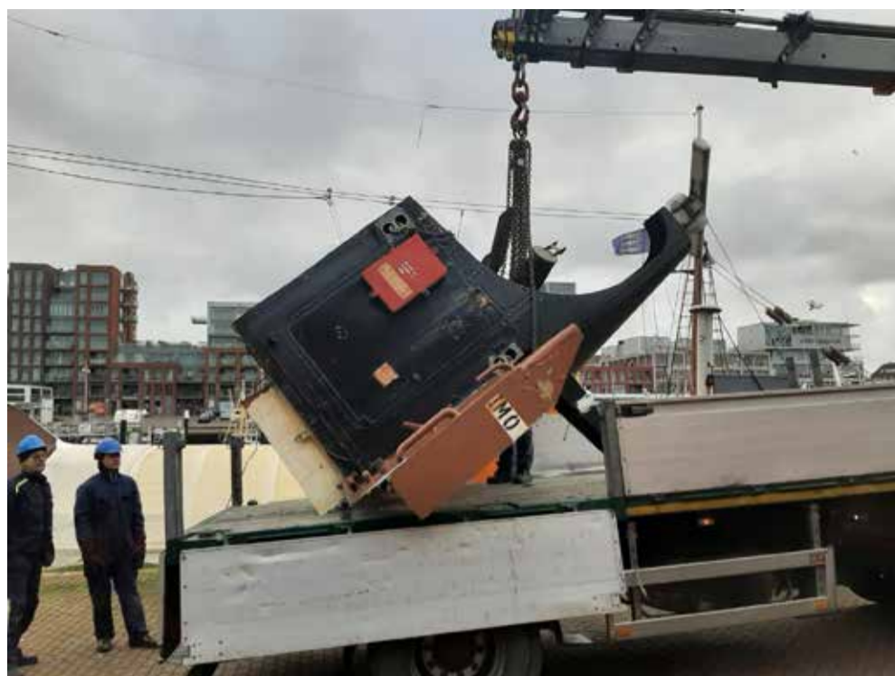
Oude pijp wordt van boord gehaald

Resultaat van deze grote operatie is dat de Noordster weer een belangrijke stap verder is op de weg naar haar oorspronkelijke gedaante. De moderne pijp met zijn steil in een hoge top uitlopende bovenkant (met daarop ook nog eens de draaiende radarantenne) heeft plaatsgemaakt voor het lagere klassieke model 1950.